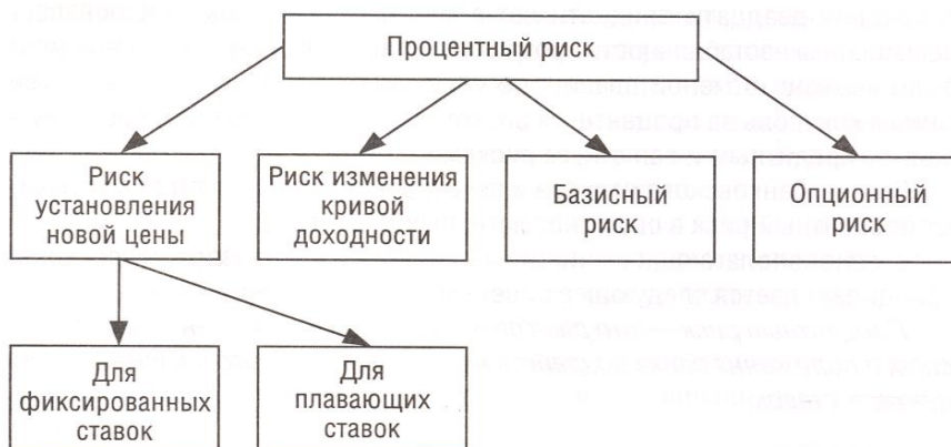
Рис. 1. Формы процентного риска